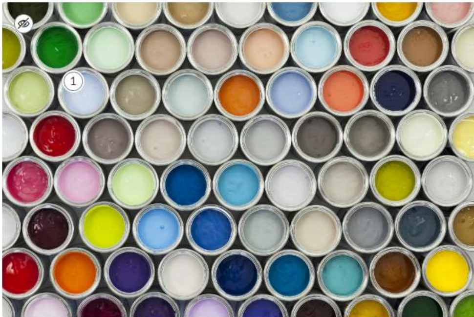
Puszki z farbami

Rozpoczynanie i kończenie zajęć o tych samych porach, również nadaje naszemu życiu rytm. Gdy nagle zachorujemy i musimy zostać w domu, mówimy o zaburzeniu rytmu. Podobne zjawisko można odnaleźć w twórczości plastycznej.