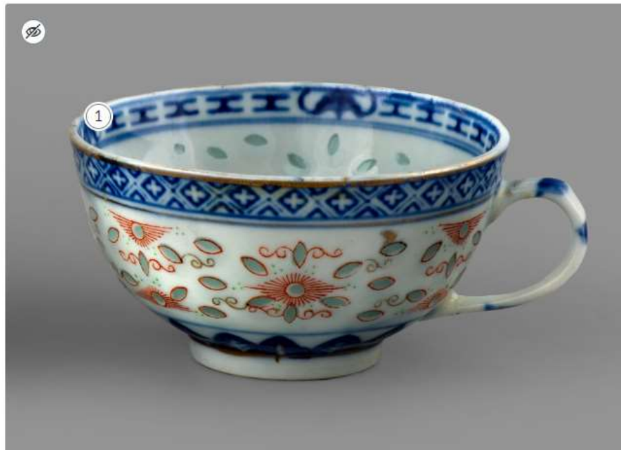
Autor nieznan, Filizanka, XIX w. Chiny, Muzeum Narodowe w Warszawie, cyfrowe.mnw.art.pl, CC BY 3.0

Przedmioty codziennego użytku też bywają przyozdobione wzorem o rytmicznym charakterze.