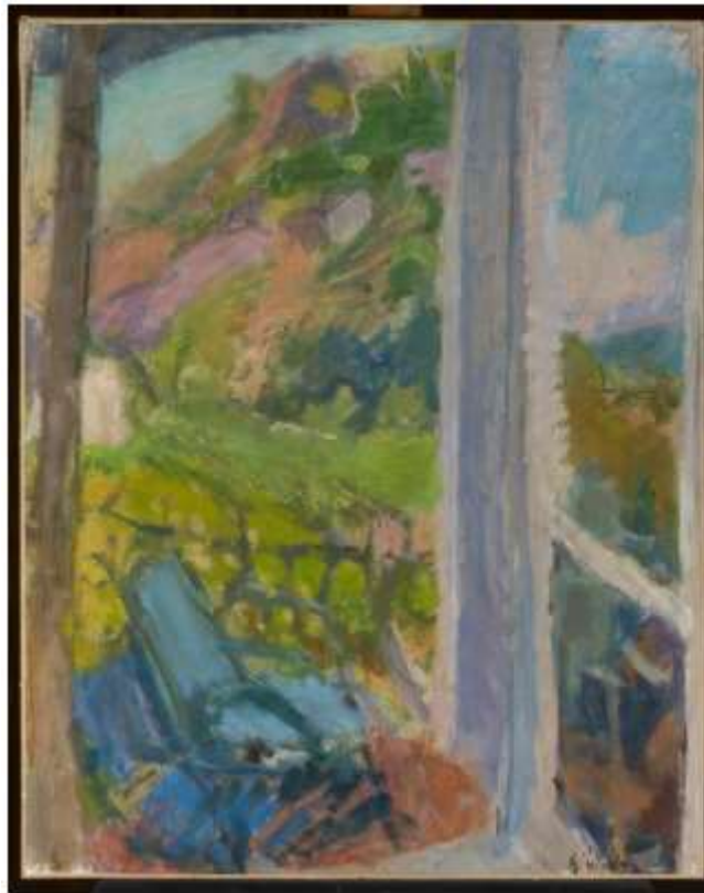
Eugeniusz Eibisch, Widok z okna, XX w., Muzeum Narodowe w Warszawie, cyfrowe.mnw.art.pl, CC BY 3.0

Wśród interaktywnych narzędzi do skorzystania online znajduje się program Canva , ma część opcji darmowych oraz oferuje gotowe grafiki do pobrania. Trzeba jednak zwrócić uwagę na oznaczenie free , bo tylko te ilustracje są bezpłatne.