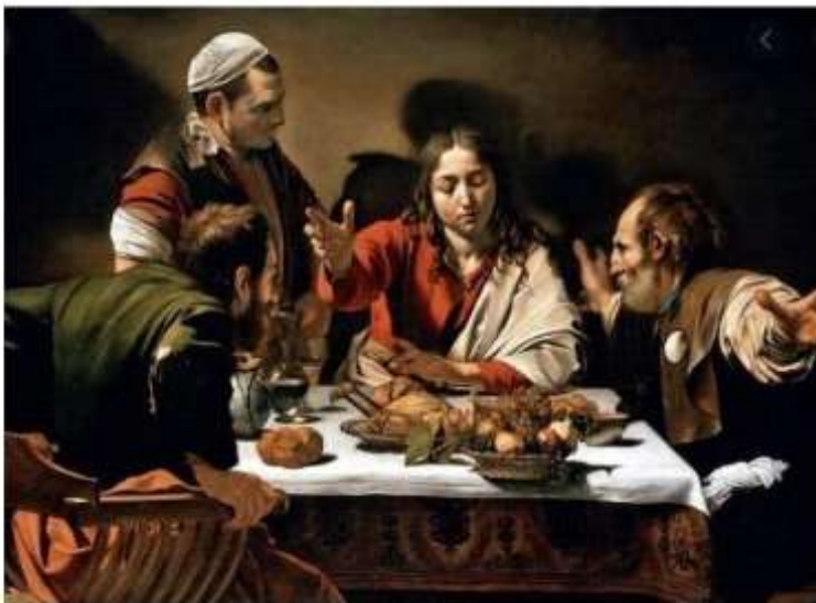
Wieczerza w Emmaus