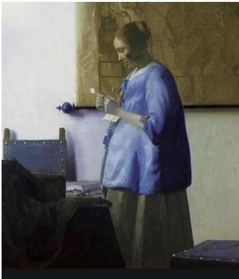
Jan Vermeer "Kobieta w błękitnej sukni"

Malarstwo barokowe czerpie swoje podstawy z osiągnięć największych postaci poprzedniego okresu, szczególnie z twórczości Michała Anioła , który wprowadził do dzieł plastycznych dynamikę . Większą wagę zaczęto przywiązywać do mimiki i gestykulacji przedstawianych bohaterów.