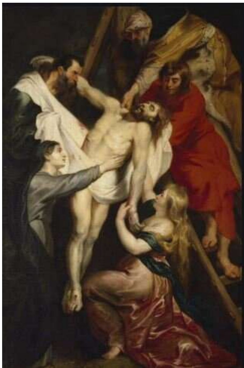
Peter Paula Rubens "Zdjęcie z krzyża "

Dynamika barokowych obrazów realizowała się również na płaszczyźnie kolorystyki i oświetlenia, zaczęto bowiem operować kontrastową, żywą paletą barw , dzięki czemu dzieła zyskały na wyrazistości i dosadności. Wielkim osiągnięciem tej epoki było wprowadzenie nowatorskiego światłocienia .