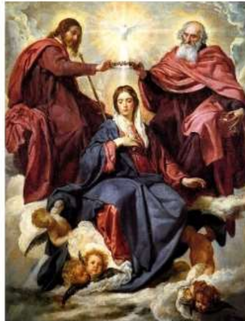
Koronacja Najświętszej Maryi Panny