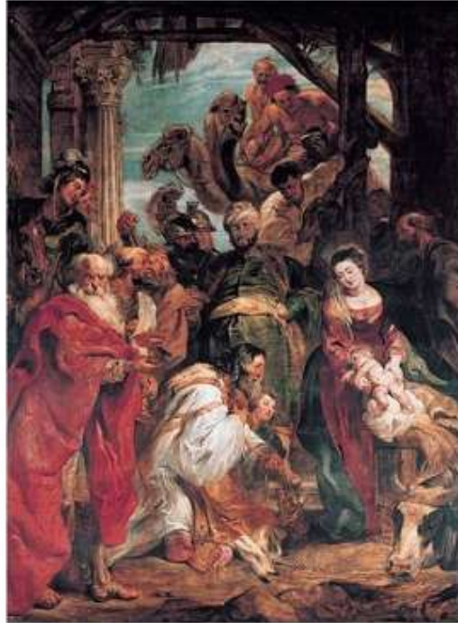
Pokłon Trzech Króli