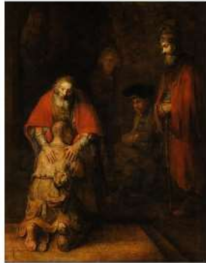
Powrót syna marnotrawnego