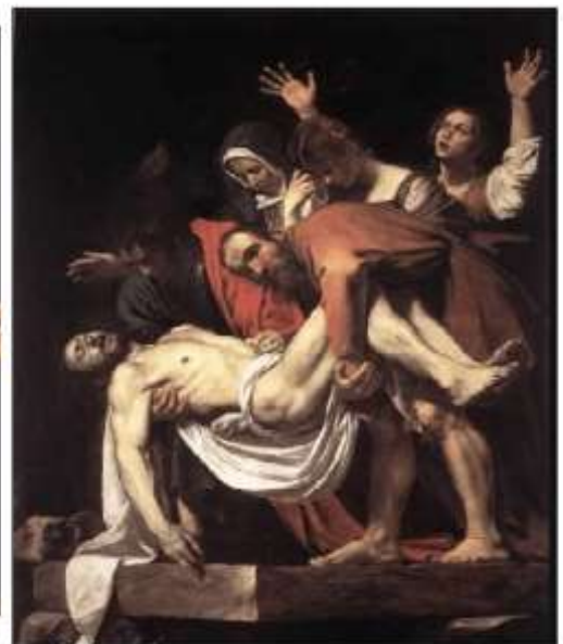
Złożenie do grobu