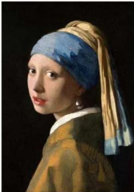
Dziewczyna z perłą